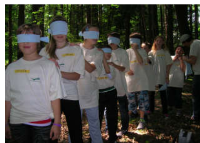
Doživljanje gozda z zavezanimi očmi

V delavnici boste pod vodstvom gozdnega pedagoga širili vedenje o poznavanju in razumevanju narave, njenih zakonitostih in okolju v katerem živimo. V gozdu, učilnici na prostem, vam bo omogočeno dožemanje okolja z vsemi čutili, to pa vas bo vodilo k opazovanju, raziskovanju, spoznavanju in odgovornemu ravnanju z naravo.